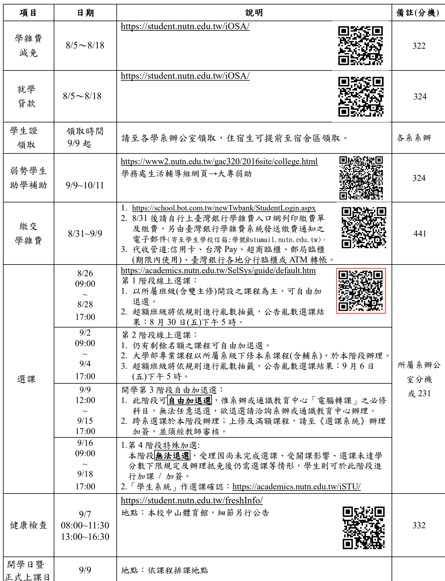
國立臺南大學 113 學年度日間研究所新生入學資料及重要日程表